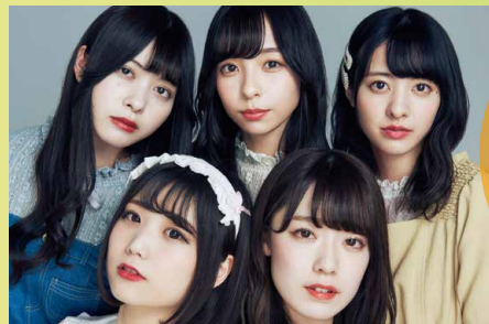
新宿 原宿発アイドルユニット