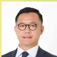
塚本堅一 元NHKアナウンサー